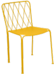
5810 - LA CHAISE DESIGN TERENCE CONRAN

Structure fil et tube acier Assise tôle acier électrozinguée Dossier fil et tube acier Poids : 5.8 kg Empilabilité : x 6 (Haut. pile : 95.4 cm) Amélioration produit : Chaise désormais empilable